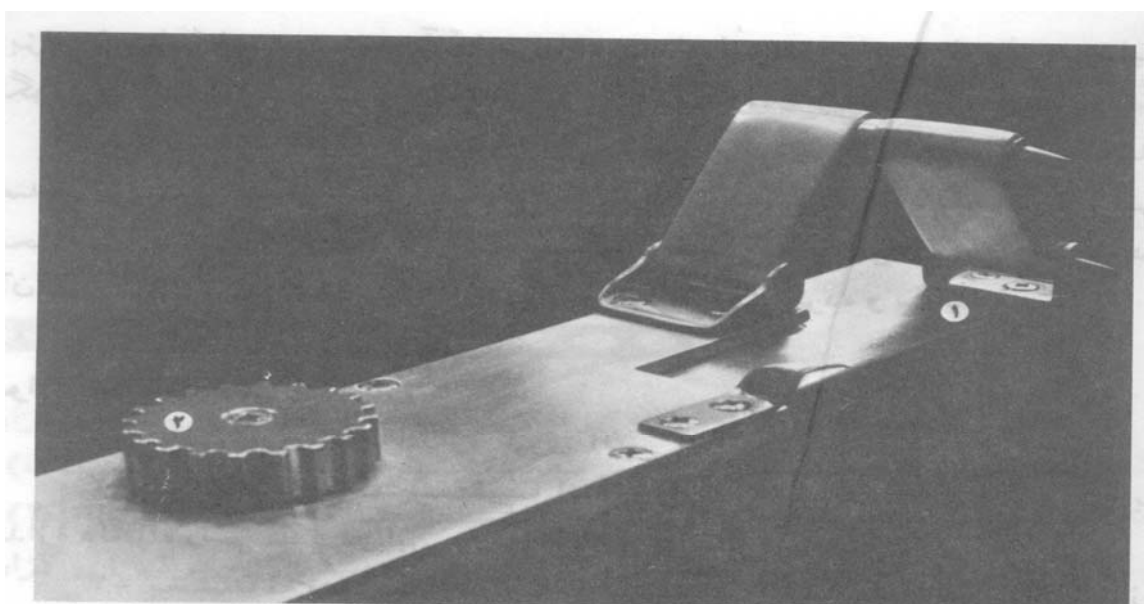
۴ درجه بندی

آنها برایم ممکن نبود. بناچار راهی دشوار و طولانی برای ساخت قطعات مورد نظر با وسایل ابتدایی مثل: سوهان، سمباره، دریل دستی، حدیده، قلاویز، سری کوچک سوهان طلاسازی و شابلونهای مختلف و وسایلی از این قبیل در پیش گرفتم. این کار به علت نداشتن وسایل مورد نیاز و لازم، برایم بسیار سخت و طولانی بود. چندین و چندبار ساختن یک قطعه را تکرار می‌کردم و این کار در مورد هر قطعه نیز بارها تکرار می‌شد. اما با تشویق‌هایی که از طرف معلمان و اولیای مدرسه می‌شدم و انگیزه قوی که برای به نتیجه رساندن آن داشتم، این مرحله را پشت سر گذاشتم و ساخت آنها به پایان رساندم، هر جا که صحبت از اندازه‌گیری و ابزار دقیق آن مطرح می‌شود، طرح و ساخت جعبه‌ها و وسایل نگهداری از لوازم فوق اهمیت بسزایی پیدا می‌کند، بنحوی که در بسیاری از موارد اهمیت نگهداری ابزارها برابر اهمیت خود آنها می‌باشد. بنابراین در ساخت ظروف و وسایل نگهداری آنها نهایت دقت و هنر طراحی همراه با ظرافت ویژه‌ای بکار می‌رود. چون بخشان وسیله‌ای بسیار دقیق و حساس بوده و در اثر ضربه و یا فشار صدمه می‌بیند و ممکن است دقت خود را از دست دهد، لازم بود که به طریقی آنها محافظت کرد. برای اینکار ساخت جعبه‌ای با شکل مخصوص که این دستگاه در آن جای گیرد، کاملاً ضروری می‌نمود که آنها طراحی کرده و ساختم.